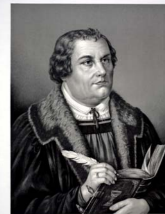
DR. MARTIN LUTHER.

Eher am Rande wurde der Wittenberger Augustinermönch zum Reichstag, der bereits im Januar 1521 begonnen hatte, vorgeladen, weil er schon seit geraumer Zeit für Unruhe sorgte. Mit seiner Forderung nach Rückkehr zu den Ursprüngen des christlichen Glaubens sprach er vielen Zeitgenossen aus der Seele. Von seinen Gegnern wurden seine Schriften allerdings als klare Kampfansage an Rom und auch als Auflehnung gegen die Obrigkeit verstanden. Nun sollte er sich distanzieren von dem, was er geschrieben hatte. Luther erbat sich Bedenkzeit und entschied sich dann kompromisslos. Wenn er nicht durch die Heilige Schrift, auf die allein er sich beziehe, widerlegt werden könne, dann wolle und könne er nicht widerrufen, „weil etwas gegen das Gewissen zu tun weder sicher noch heilsam ist“.